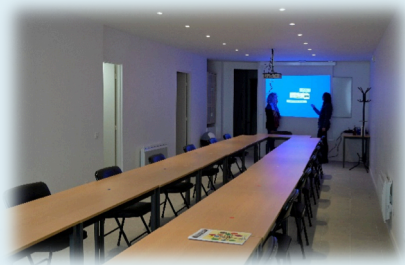
Salle de Causserouge

La première acquisition, qui se situe 9 rue Causserouge, a nécessité de lourds travaux. Les consignes sanitaires font que cette salle n'a, pour l'heure, été que peu utilisée. L'autre bâtiment se trouve 266 rue Pelleport et il est en cours de réaménagement. Une fois restructuré, il comprendra une très belle entrée avec des murs en pierres apparentes, une première salle de petite taille pouvant recevoir en temps normal jusqu'à 10 personnes. À l'arrière se trouvera une pièce assez spacieuse qui, avec la mise en place d'une ventilation mécanique, pourra accueillir des cours de gymnastique, de danse, et plus largement d'arts de la scène. Enfin, deux espaces destinés aux vestiaires compléteront l'ensemble. Ce lieu sera proposé aux étudiants dès la rentrée 2021-2022. Pour cette acquisition, l'UTL a préféré emprunter une somme de 440 000 euros, afin de préserver un fond de trésorerie pour continuer à faire face, le cas échéant, aux aléas d'une poursuite de la crise sanitaire.