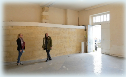
Entrée actuelle de Pelleport

Pour en revenir aux locaux de la rue Broca, les activités ne pourront s'exercer que dans les deux salles présentant des normes sanitaires satisfaisantes : l'une, qui donne sur la rue Paul Broca, et l'autre, attribuée aux activités sportives. Les salles sans possibilité de renouvellement d'air ne seront plus utilisées.